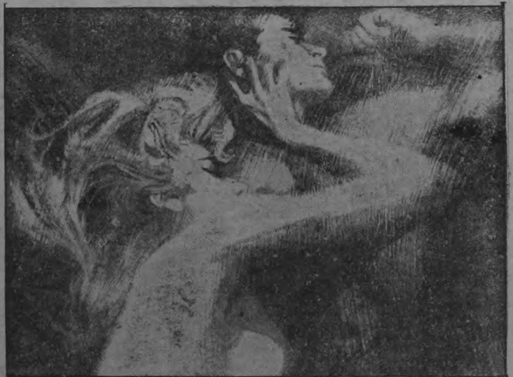
Una muy expresiva escena de la película AMOR PROFANO (Fedra). Los papeles estelares a cargo de Melissa Mercuri, Anthony Perkins y Raf Vallone.

En los primeros días del presente mes de enero, en la Ciudad de México se casaron la juvenil y popular estrella mexicana Teresa Velázquez y el actor y productor español Espartaco Santoni a la ceremonia asistieron altas personalidades del cine mexicano. El nuevo matrimonio salió en viaje de bodas a Europa.