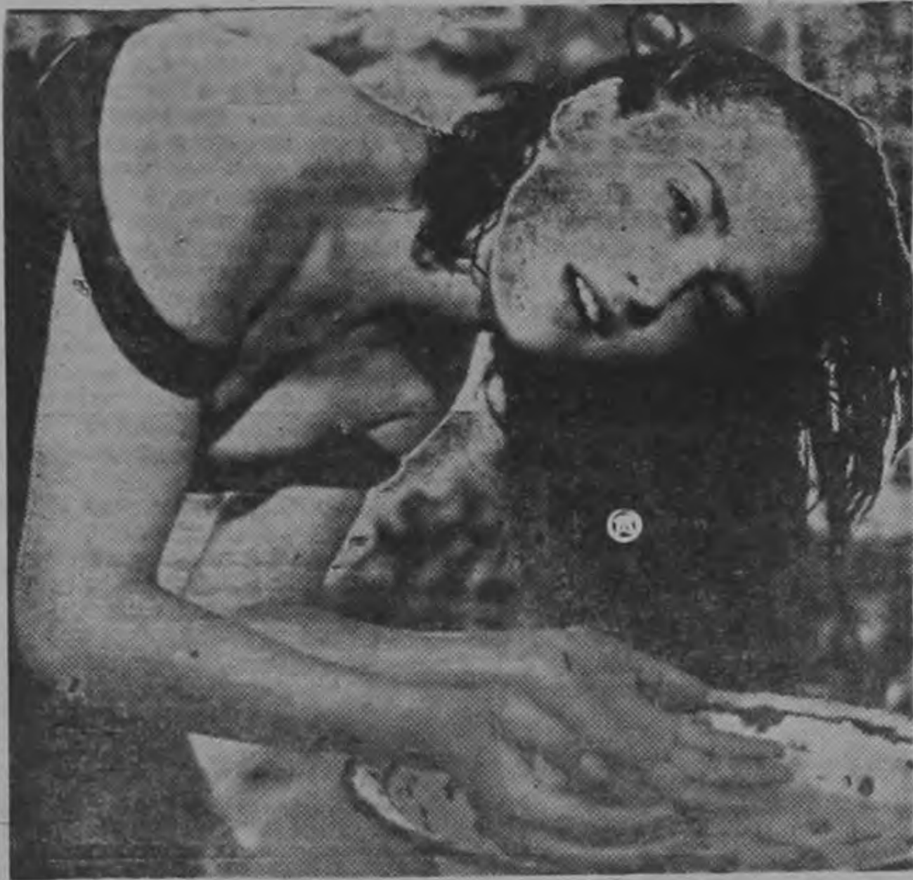
Una preciosa foto de NORMA ANGELICA, joven artista mexicana que tenía un gran porvenir en el cine, pero que decidió terminar con su vida, cuando más le sonreía, al menos así lo creían los demás. ¿Se repite la historia de Marilyn Monroe?