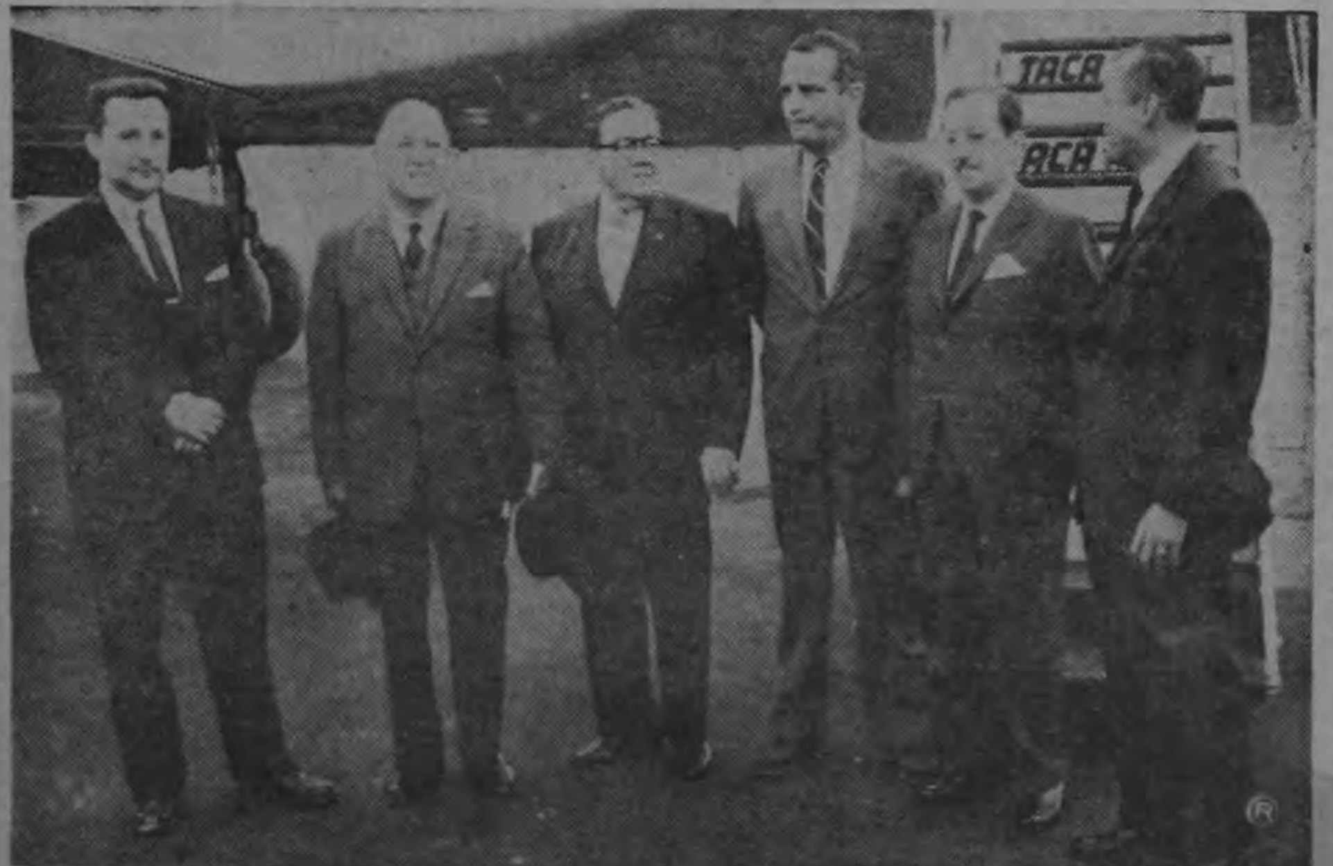
El Ministro de Relaciones Lic. don Daniel Oduber Quirós aparece con los señores cancilleres en un aparte en el Aeropuerto de El Coco, momentos después de su arribo. Anoche el Canciller Oduber